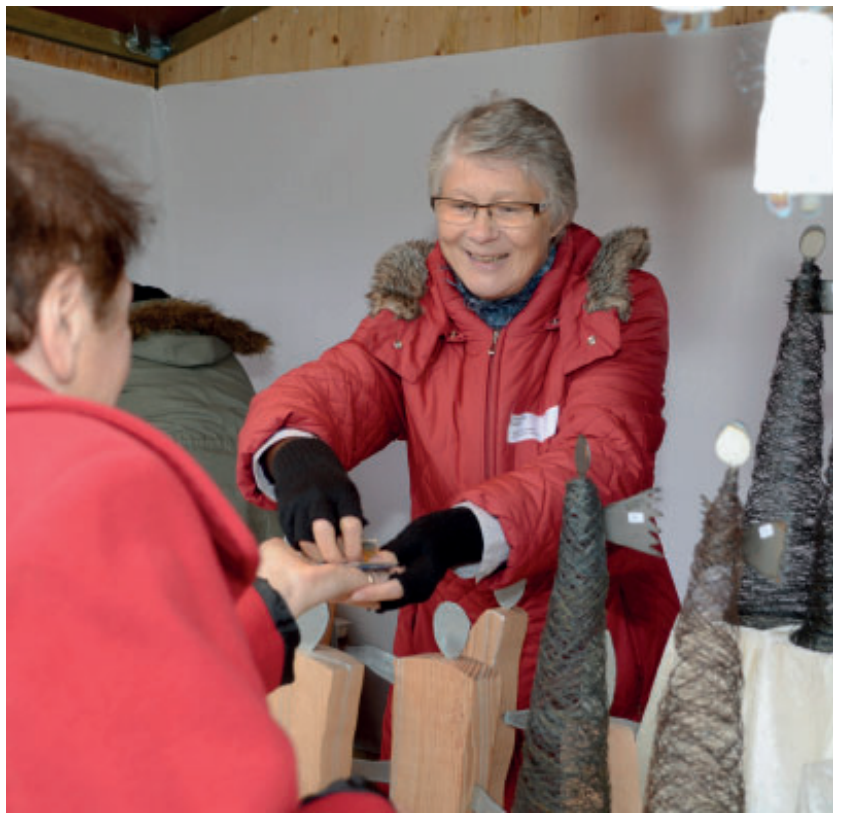
Einsatz bei Anlässen der Stiftung MBF