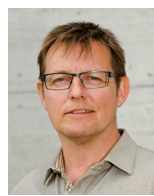
René Jost Springer Produktion 1 Stimmzähler Vertretung VP